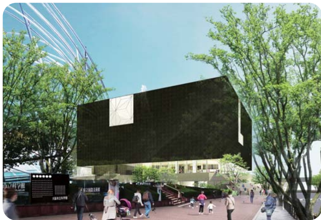
外観イメージ (南側より)